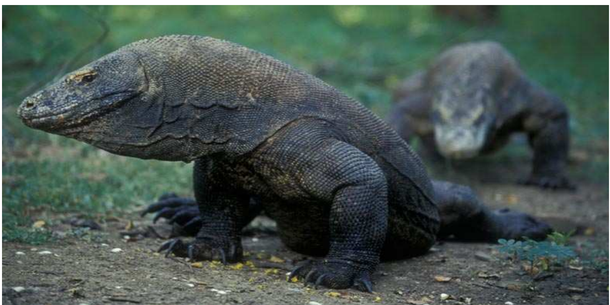
Text: Alexandra Bürger