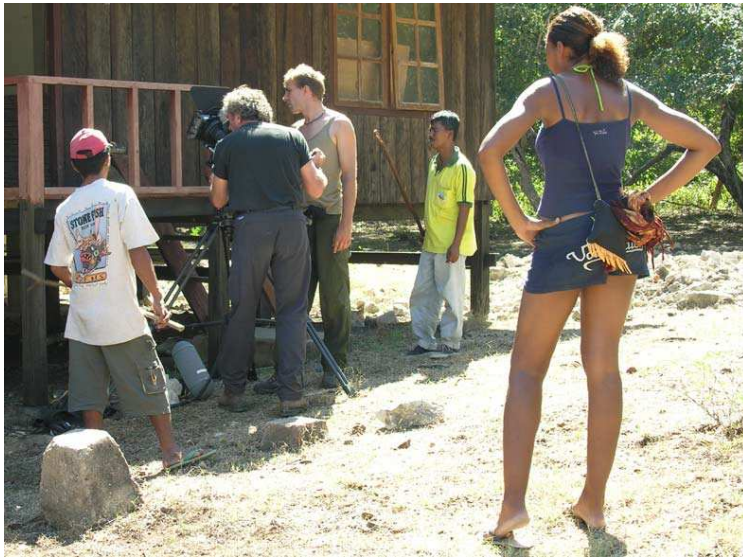
Schnecke beim Zuschauen