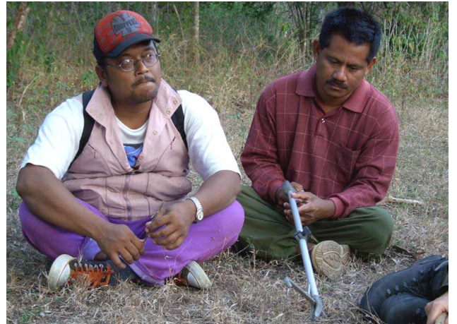
Nurwan und der Kaptain