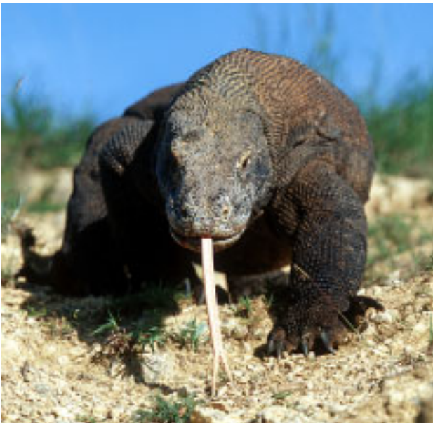
Abb. 2: Varanus komodoensis von Rinca Fig. 2: Varanus komodoensis from Rinca

Durch boomenden Tourismus auf der weiter westlich gelegenen Ferieninsel Bali wurde der „Tagesausflug zu den letzten Dinosauriern“ die große Attraktion jeder Indonesienreise in den neunziger Jahren. Der Komodowaran war somit recht gründlich erforscht und noch gründlicher vermarktet. Umso erstaunlicher ist daher die Tatsache, dass über seine Verbreitung und Erscheinungsform auf der benachbarten Insel Flores kaum genaues Material existiert. Erstmals wurde das Vorkommen des Komodowarans auf Flores von DE ROOIJ (1915) erwähnt und für die Westküste der Insel (Laboan Badjo) begrenzt. Inzwischen finden sich in der