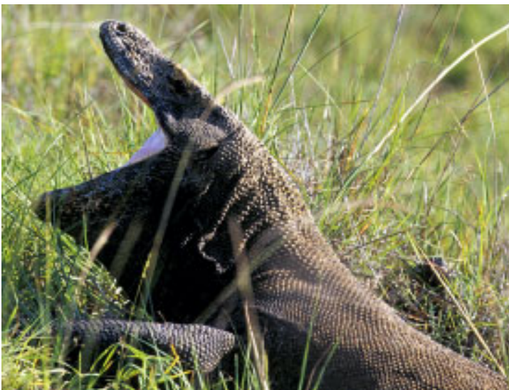
Abb. 7: Gähnender Varanus komodoensis von Rinca, Komodo National Park, Indonesien Fig. 7: Varanus komodoensis , yawning (Rinca, Komodo National Park, Indonesia)

Reisedokumentation zu machen. Auch dieses Mal berichtete der aktuelle Reiseführer (MULLER 1997) über Komodowarane: angeblich sollten einige der Warane in einer Höhle bei der Damu-Bucht hausen. Allerdings sei dies weder vom WWF noch von den indonesischen Behörden bestätigt (MULLER l.c.). Nichtsdestotrotz könne man eine dieser geheimnisvollen Echsen im Käfig der Rangerstation besichtigen und gegen eine geringe Gebühr sogar mit Hühnereiern füttern (MULLER l.c.).