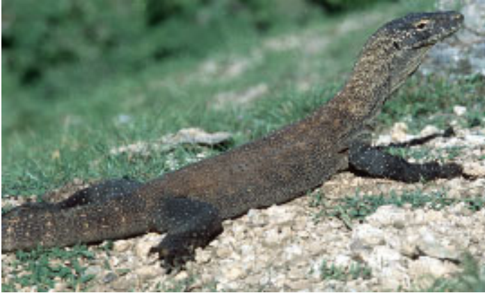
Abb. 11: Jungtiere von Varanus komodoensis auf Rinca, Indonesien Fig. 11: Juvenile Varanus komodoensis at Rinca, Indonesia

wie bei dem kleineren Exemplar, aber im Vergleich zu den bisher bekannten Tieren immer noch ungewöhnlich. Am Schwanzrücken hatte das Tier zwei halbrunde Einbuchtungen, die wie abgeheilte Bisswunden aussahen. Außerdem war auf seiner rechten Schulter ein auffallend glatter Fleck, der ebenfalls einer verheilten Wunde glich.