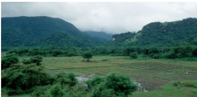
Abb. 5: Biotop mit Reisfeldern hinter Riung Fig. 5: Biotope and rice paddies beyond Riung

Im August 1993 besuchte der Autor erstmals das Fischerdorf Riung an der Nordküste von Zentralflores. Der Ort ist Ausgangspunkt für Exkursionen zu den vorgelagerten sieben Inseln des Pulau Tujuhbelas Marine Reservats, die Hauptattraktion dieser verhältnismäßig abgelegenen Gegend. Schon damals hieß es in der einschlägi-