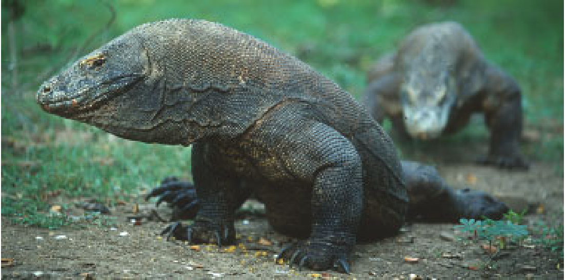
Abb. 6: Imponierender Varanus komodoensis von Rinca, Komodo National Park, Indonesien Fig. 6: Imposing Varanus komodoensis from Rinca, Komodo National Park, Indonesia

gen Reiseliteratur, dass man im Hinterland vereinzelt „Komododrach“ antreffen könnte, doch seien diese im Vergleich zum KNP eher selten. Vielversprechender wäre es, sie mit dem Kadaver eines Haustieres anzulocken. Diesbezügliche Nachforschungen bei der lokalen Bevölkerung ergaben, dass dies prinzipiell möglich, allerdings mit größerem Aufwand verbunden sei, da zuerst ein Ködertier gekauft und dieses dann in abgelegene Regionen transportiert werden müsste, da sich die Warane nicht in die Nähe der Straßen und Dörfer wagten.