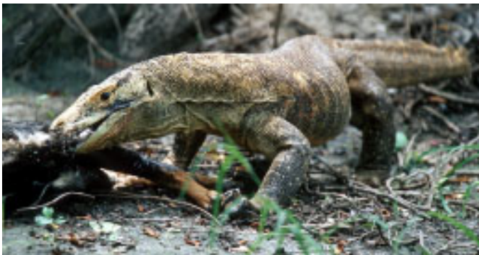
Abb. 9: Großer Varanus komodoensis bei Torong Padang, Flores, Indonesien (P) Abb. 9: The larger Varanus komodoensis at Torong Padang, Flores, Indonesia (P)

Als wir aber mit dem Besitzer der angrenzenden Felder zu dem Felsen gelangen wollten, stellte sich heraus, dass dies gar nicht so einfach war, und wir brauchten fast eine Stunde, um uns ei-