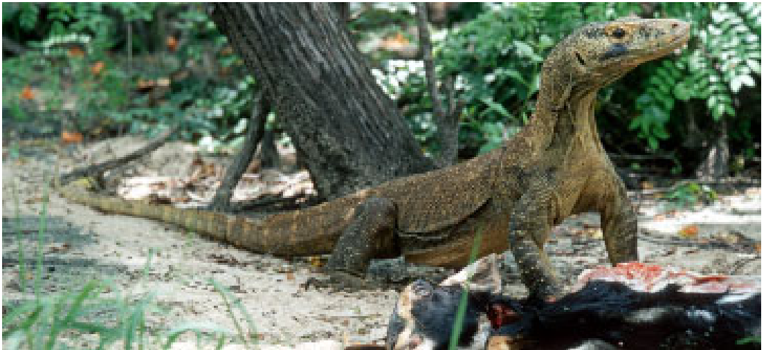
Abb. 10: Großer Varanus komodoensis bei Torong Padang, Flores, Indonesien (P)