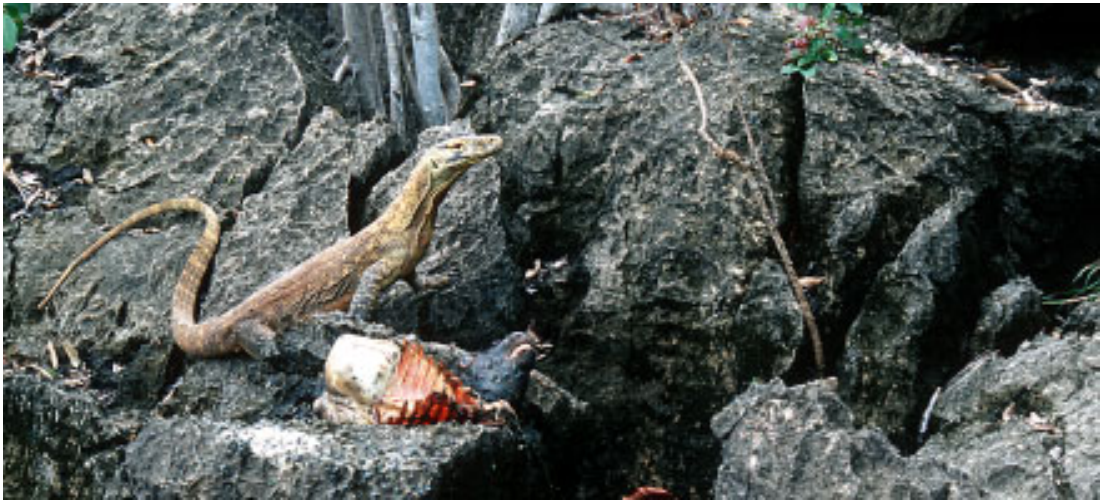
Abb. 8: Kleiner Varanus komodoensis bei Mboras auf Flores, Indonesien (P) Fig. 8: The smaller Varanus komodoensis at Mboras on Flores, Indonesia (P)

Natürlich sollte dieses Tier unmittelbar nach unserer Ankunft in Riung besichtigt und, wenn möglich, auch mit Hühnereiern gefüttert werden. Doch angeblich war der Waran inzwischen zu groß für seinen Käfig und wieder freigelassen worden. Lediglich ein einziges, unscharfes Foto war vorhanden, das tatsächlich einen V. komodoensis mittlerer Größe zeigte, der interessanterweise auffallend gelblich gefärbt war. Auch eine Broschüre vom indonesischen Amt für Tourismus, die in unserer Unterkunft aushing, enthielt dieses Foto und wies auf die außergewöhnliche Färbung der „Riung-Warane“ hin. Neugierig geworden, befragten wir auf unseren zahlreichen Exkursionen in der Gegend die einheimische Bevölkerung nach Waranen. Dabei wollten wir explizit wissen, ob es eine oder zwei Arten dieser Echsen gibt. In den Mangroven rund um den Ort lebt nämlich eine große Anzahl des Bindenwarans V. salvator . Diese können ebenfalls kapitale Längen erreichen und innerhalb ihres riesigen Verbreitungsgebietes in vielen